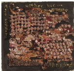
スザンナ・スパーヒ