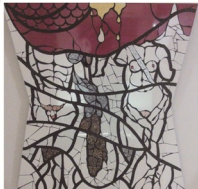
オローデ・デオーロ