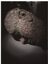
マルコ・ランディ (土台は彫刻家の作品)