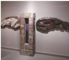
パオロ・ラッカーニ