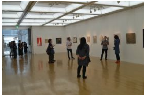
横浜市民ギャラリーあざみ野